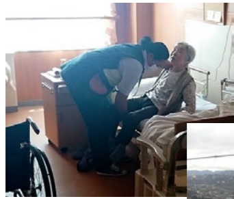
▲周囲への目配りと気配りも忘れません