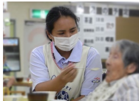
▲真面目で力持ち。また非常に高い介護技術に驚きました(汗)