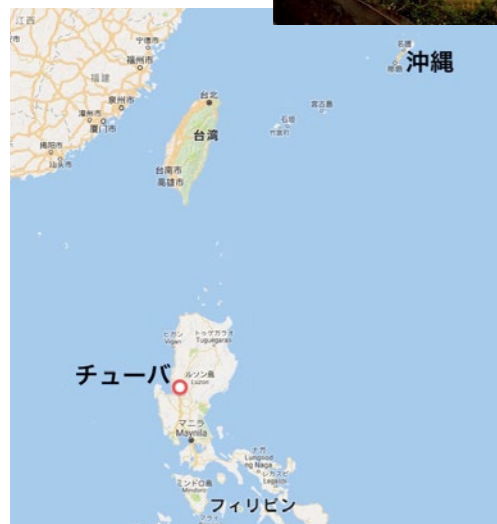
▲長野市からは南西方向に直線距離で約 2,800km。首都マニラから北へ 200km にあるのがジュリエトさんの故郷「チューバ」