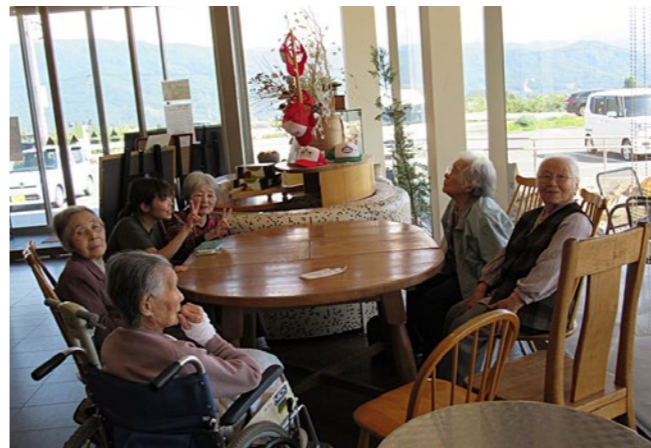
▲グループホームコスモス松川では年間を通じて、外出・外食の機会を多く計画しております。職員も一緒に出かける事を楽しみに、日々支援させていただきます。写真は笑顔に溢れる外食時の一コマです

分が相手の立場に立って気を付けられているかという疑問が出てきます。その度に立ち止まって一つひとつ意識していくことが大切だと考えます。小さなことに気が付き、利用者の状態が把握できていれば慌てることなく対応できます。その先に利用者の笑顔があり、笑顔を見た職員も笑顔になれる。それこそが、職員が働きやすい環境になるのではないかと思います。