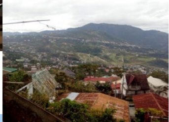
▼故郷はルソン島の山あいの小さな街『チューバ』