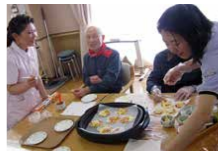
▲餃子の皮に玉ねぎなどをのせて焼きました