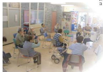
介護老人保健施設 コスモス長野 一般棟