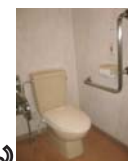
男性用トイレ・女性用トイレ 車椅子用トイレをそれぞれ設置