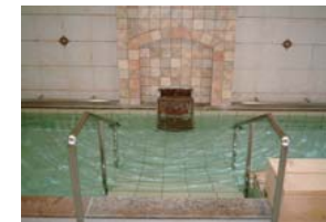
大きな浴室でゆったりと