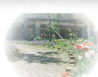
花の散歩道で歩行訓練