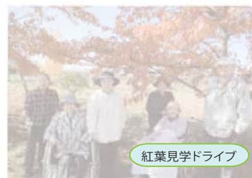
紅葉見学ドライブ