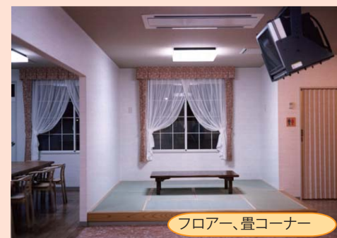
フロアー、畳コーナー